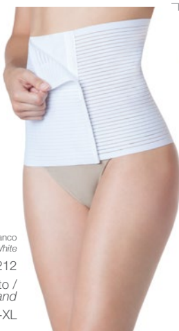
Branco White 2412212 Faixa pós-parto / Postpartum band S-M-L-XL